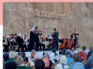
اجرای موسیقی ارگستر سمفونیک